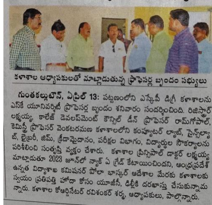
కళాశాల ఆధ్యాపకులతో మాట్లాడుతున్న ప్రాఫెసర్ల బృందం సభ్యులు

డిగ్రీ కళాశాలను సందర్శించిన ప్రాఫెసర్ల బృందం